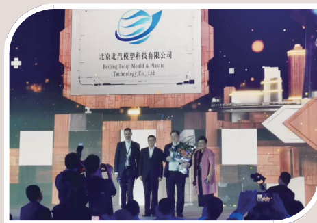
▲5月9日，北京北汽模塑科技有限公司荣获奔驰供应商大会合作奖。