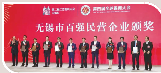
▲5月21日，江阴模塑集团有限公司荣获“无锡市百强民营企业”。